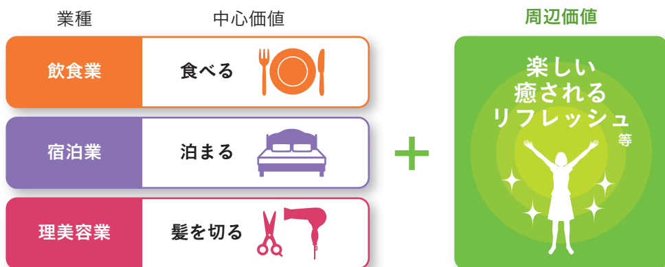
図表2：女性がお店に求めること

また、これは宿泊業や理美容業などにおいても同様です（図表2参照）。このような「女ゴコロ」の特徴を踏まえ、お店の「周辺価値」を高めるポイントをみていきたいと思います。